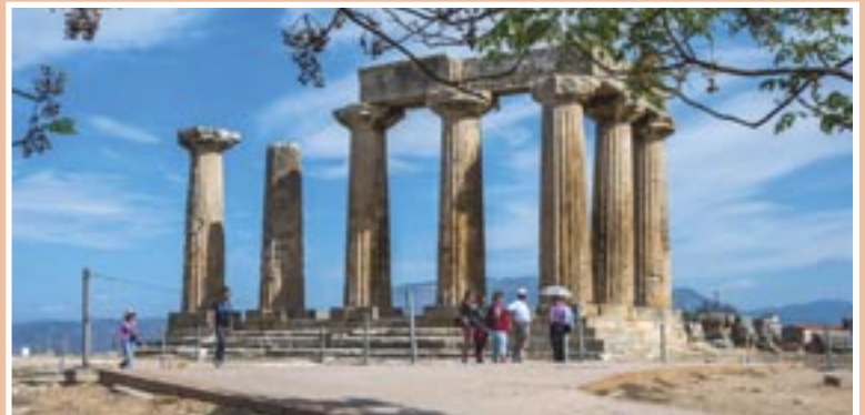
Από την υπέροχη εκδρομή του Συλλόγου Συνταξιούχων ΑΤΕ στο διάπλου του Ισθμού της Κορίνθου, την επίσκεψη στην Ακροκόρινθο, το Αρχαιολογικό Μουσείο της Αρχαίας Κορίνθου, καθώς επίσης και την επίσκεψη στον Όσιο Πατάπιο, στις 10 Οκτωβρίου 2024.