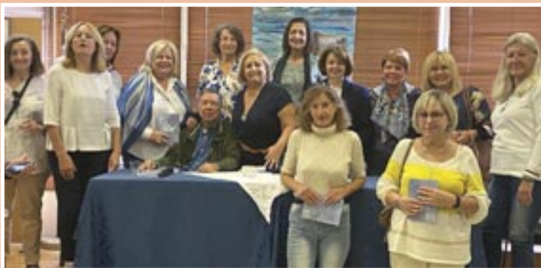
Από την παρουσίαση βιβλίου του αγαπητού μας συναδέλφου Μ. Γιαννουλέα στη Θεσσαλονίκη, σε συνεργασία με το ΠΟΚΕΑΤΕ και την Ένωση Βορείου Ελλάδος