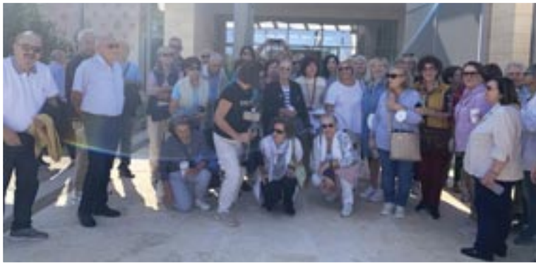
Από την επιτυχημένη ημερήσια εκδρομή της Ένωσης Συνταξιούχων Βορείου Ελλάδος στο Μουσείο Αιγών και το Ανάκτορο Φιλίππου στις 10 Οκτωβρίου 2024