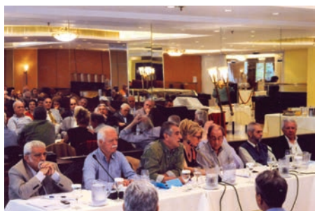
Από τη φετινή τακτική, γενική μας συνέλευση στις 18/5 στο ξενοδοχείο ΤΙΤΑΝΙΑ. Ρεπορτάζ στις σελίδες 2,3 και 4.

Το Σεπτέμβριο του 2013 οι υπάλληλοι κερ-