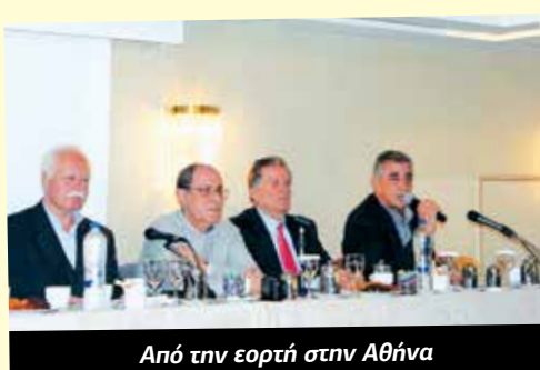
Από την εορτή στην Αθήνα