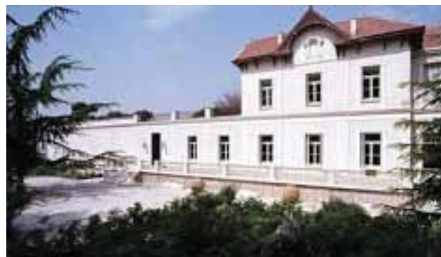
8) Μουσείο Γουλανδρή Φυσικής Ιστορίας

Με άπειρα είδη από την πανδία και την χλωρίδα, το μουσείο σου προσφέρει ένα διασκεδαστικό και άκρως επιμορφωτικό μάθημα φυσικής ιστορίας.