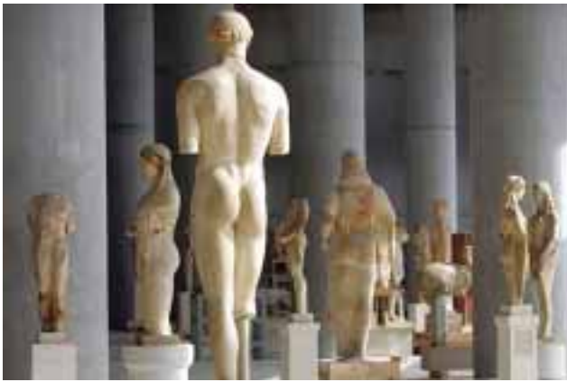
1) Εθνικό Αρχαιολογικό Μουσείο