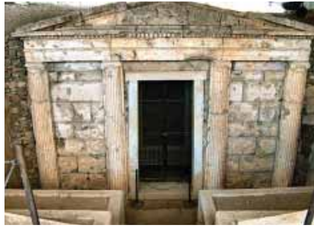
5) Βεργίνα - Πέλλα

Ο αρχαιολογικός χώρος της Βεργίνας με τους μεγαλοπρεπείς τάφους είναι ένα υποβλητικό θέαμα. Από την άλλη η αρχαία Πέλλα σου δίνει τη δυνατότητα να φανταστείς τη ζωή των αρχαίων Μακεδόνων.