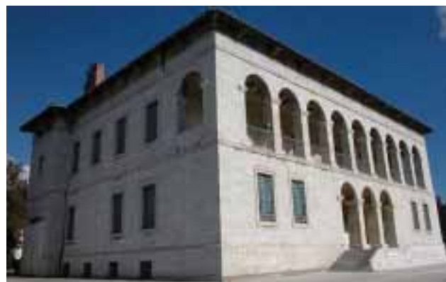
6) Βυζαντινό και Χριστιανικό Μουσείο Αθήνας

Περισσότερα από 25.000 εκθέματα με μοναδικές συλλογές εικόνων, γλυπτών, μικροτεχνίας, τοιχογραφιών, κεραμικών, υφασμάτων, χειρογράφων αλλά και αντιγράφων από τον 3ο αιώνα μέχρι τον σύγχρονο φιλοξενοούνται στο Βυζαντινό μουσείο της Αθήνας.