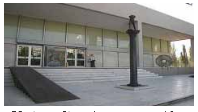
12) Εθνική Πινακοθήκη

Ειδικεύεται σε δύο τομείς, την αναγεννησιακή ζωγραφική και την προβολή της Ελληνικής Ζωγραφικής κατά τους αιώνες.