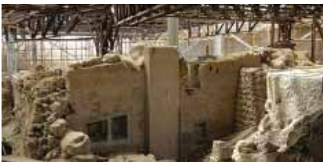
4) Ακρωτήρι Θήρας

Μετά από 7 χρόνια το Ακρωτήρι Θήρας υποδέχθηκε και πάλι το κοινό. Ο αρχαιολογικός χώρος παρέμεινε κλειστός από το Σεπτέμβριο του 2005 μετά την κατάρρευση τμήματος του στεγάστρου που είχε στοιχίσει τη ζωή σε έναν άνθρωπο.