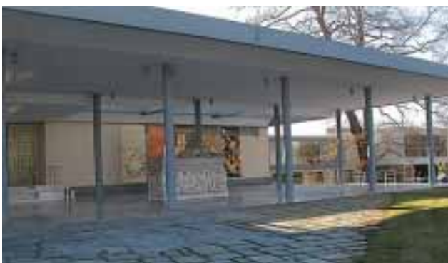
2) Αρχαιολογικό Μουσείο Θεσσαλονίκης

Εξίσου σημαντικό και το Αρχαιολογικό Μουσείο της Θεσσαλονίκης με τους «Θησαυρούς της Βεργίνας του», ενώ το 2001 το ίδιο το μουσείο κηρύχθηκε διατηρητέο μνημείο από το Υπουργείο Πολιτισμού.