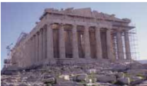
3) Παρθενώνας και Νέο Μουσείο Ακρόπολης

Γενικότερα ο αρχαιολογικός χώρος της Ακρόπολης είναι ένας προορισμός ζωής για Έλληνες αλλά και ξένους. Χιλιάδες άνθρωποι συρρέουν κάθε χρόνο στην Ακρόπολη για να δουν με τα ίδια τους τα μάτια το μεγαλείο της ανθρώπινης θέλησης. Το Νέο Μουσείο της Ακρόπολης έχει λάβει άπειρους επαίνους και βραβεία για την αισθητική του, την κομψότητά του καθώς και για τις γνώσεις που προσφέρει στους επισκέπτες του.