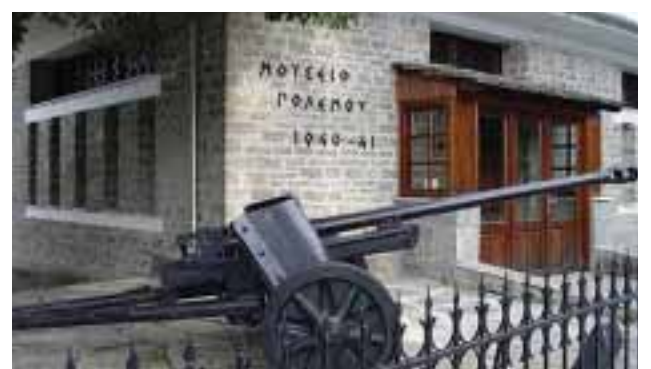
13) Πολεμικό Μουσείο Καλπακίου

Εκτός από την αρχαία ιστορία, συγκίνηση και δέος προκαλεί και η σύγχρονη. Στο πολεμικό μουσείο του Καλπακίου, λίγο έξω από τα Ιωάννινα, υπάρχουν εκθέματα που αφορούν την ηρωική αντίσταση του Ελληνικού λαού στην επίθεση των Ιταλικών στρατευμάτων στον πόλεμο του 1940-41.