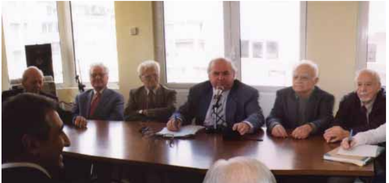
Το προεδρείο της Γενικής Συνέλευσης

Η Γενική Συνέλευση αποφασίζει ομόφωνα να προτείνει στο Δ.Σ. του Ταμείου Υγείας και του ΕΛΕΜ, να πάρει α-