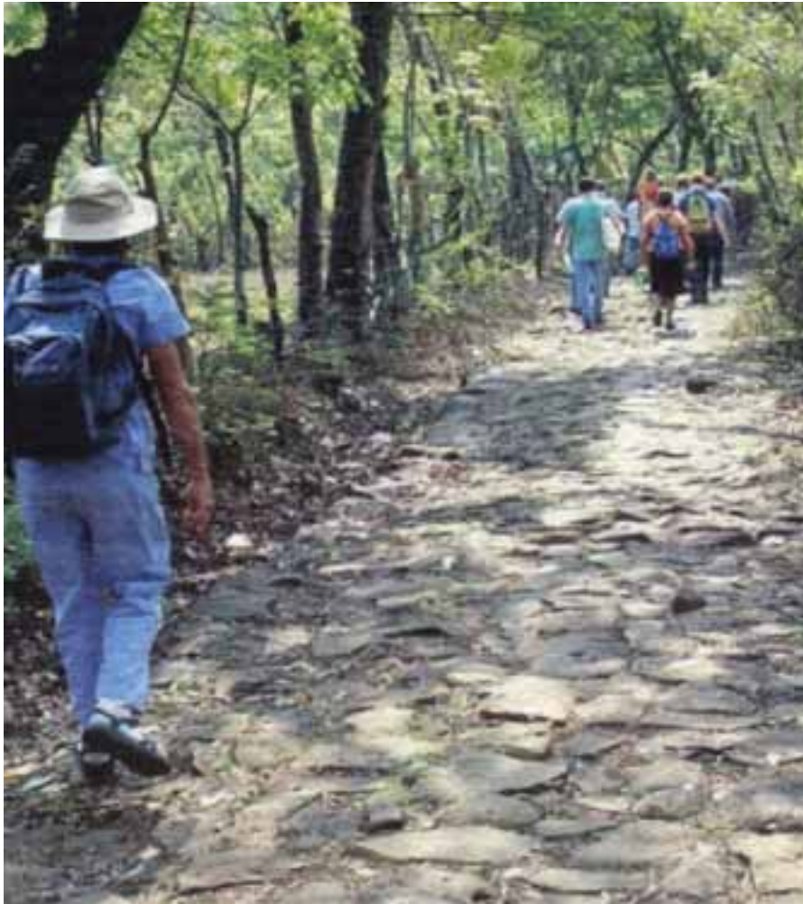
- Δείξε κατανόηση σε αυτούς που συντελούν στη βελτίωση της ενεργειακής και περιβαλλοντικής συντήρησης (ποιότητα του αέρα, νερού, ανακύκλωση, ασφαλή διοίκηση των αποβλήτων και τοξικών προϊόντων, ηχορύπανση κ.λπ.) και οι οποίοι προωθούν ειδικευμένο και εκπαιδευμένο προσωπικό.

ση των αποβλήτων και τοξικών προϊόντων, ηχορύπανση κ.λπ.) και οι οποίοι προωθούν ειδικευμένο και εκπαιδευμένο προσωπικό.