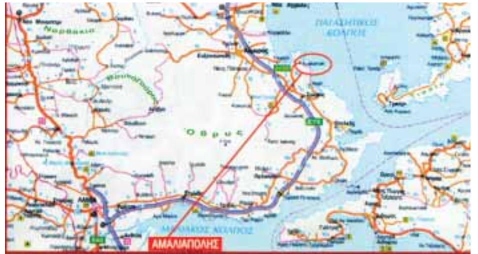
Στον Παγασητικό δίπλα στον Αλμυρό